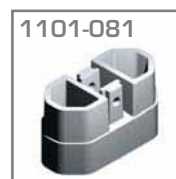
1101-081 * Adaptador Material. Acero Acabado. Gris metalizado Pz = 1

*Pieza opcional con la cual se evita el roscado del perfil LUSO