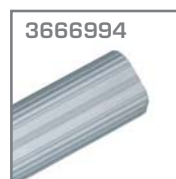
3666994 Tubo oval 3 mts. Material. Aluminio Pz = 1