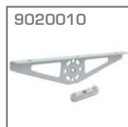
9020010 Soporte estantes Material. Acero Acabado. Gris metalizado Jgo.