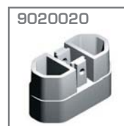
9020020 * Adaptador Material. Acero Acabado. Gris metalizado Pz = 1

*Pieza opcional con la cual se evita el roscado del perfil LUSO