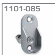
1101-085 Soporte lat. tuvo oval Material. Zamac Acabado. Niquel Pz = 1