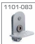
1101-083 Soporte antivuelco 1 Material. Acero Acabado. Gris metalizado Pz = 2