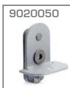
9020050 Soporte antivuelco 1 Material. Acero Acabado. Gris metalizado Pz = 2