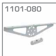
1101-080 Soporte estantes Material. Acero Acabado. Gris metalizado Jgo.