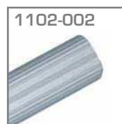
1102-002 Tubo oval 3 mts. Material. Aluminio Pz = 1