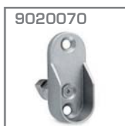
9020070 Soporte lat. tuvo oval Material. Zamac Acabado. Niquel Pz = 1