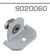
9020060 Soporte antivuelco 2 Material. Acero Acabado. Gris metalizado Pz = 2