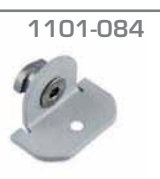
1101-084 Soporte antivuelco 2 Material. Acero Acabado. Gris metalizado Pz = 2